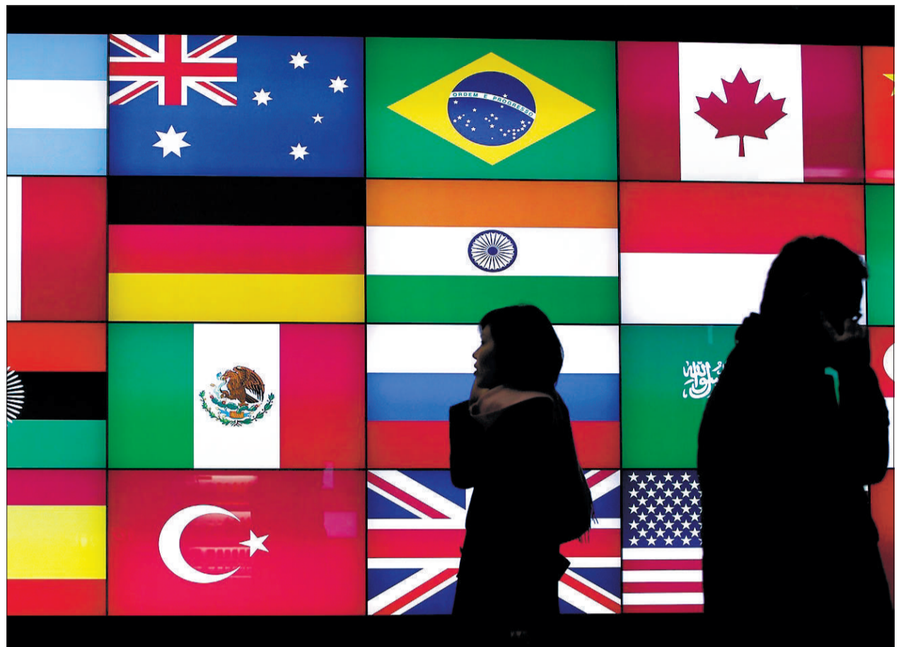
Eine Anzeigentafel in Seoul zeigt die Flaggen der Länder, die am G-20-Gipfel teilnehmen.

Oechslin: Ansonsten droht eine Erhöhung der Arbeitslosigkeit und massive soziale Unrast. Die USA hingegen müssen signalisieren, dass sie ihre expansi-