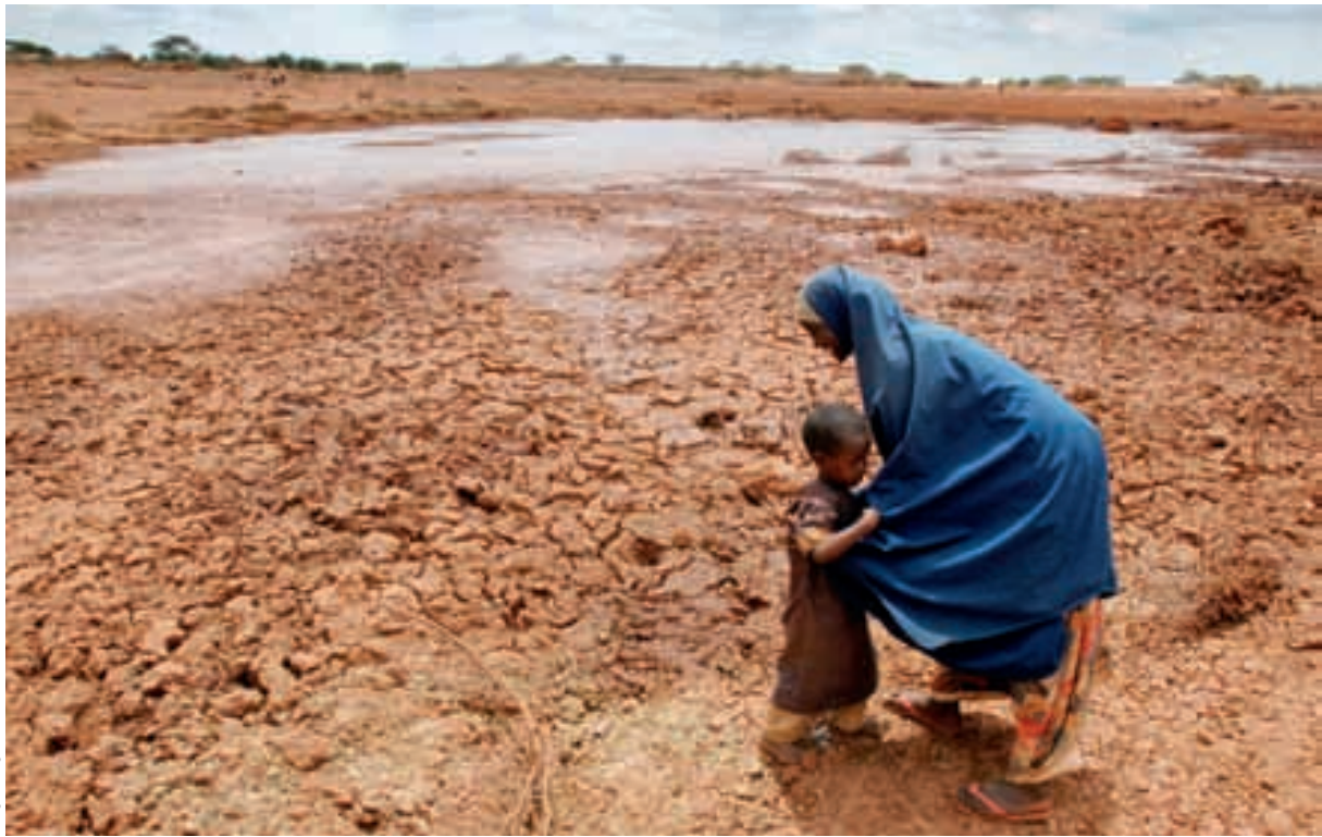
Le Figaro Magazine/Infra