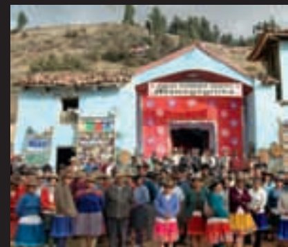
In Kinofilmen aus Lateinamerika ist die Urbevölkerung nur selten ein Thema – nicht so bei Claudia Llosa, deren Filme «La teta asustada» (obere Reihe) und «Madeinusa» von der Vorstellungswelt der Andenbevölkerung handeln

spricht von «recién bajados», frisch Gestrandeten. Ich will den Gegensatz zwischen der althergebrachten Kultur und dem, was alles Weisse symbolisiert, sichtbar machen. Deshalb schleppt Fausta am Ende des Films die Leiche ihrer Mutter an den Strand und sagt zu ihr: Mama schau, das Meer! Lima soll sich stärker für die Anden interessieren, aber die Andenwelt soll ihren Blick auch der von Lima verkörperten Küste zuwenden.